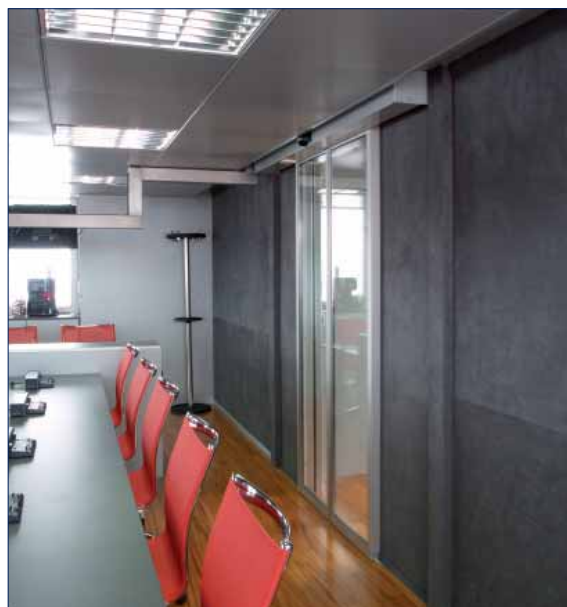
Scuderia Toro Rosso