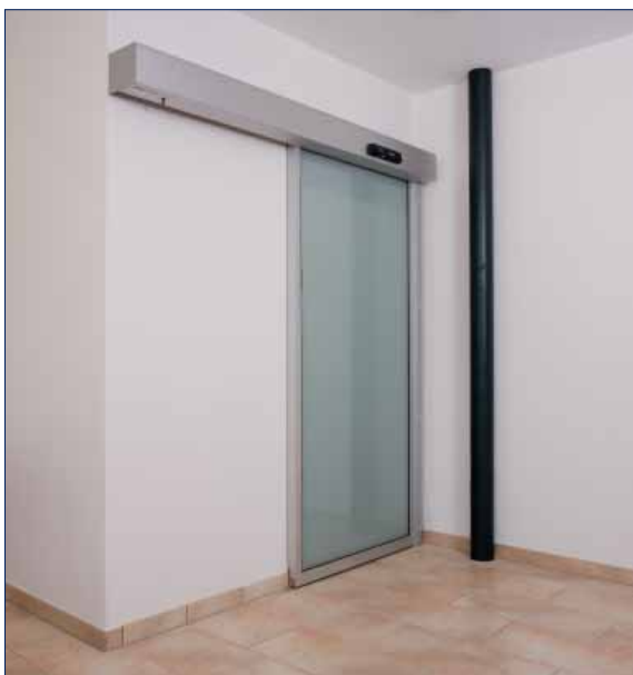
Hubertus Hotel Schluchsee