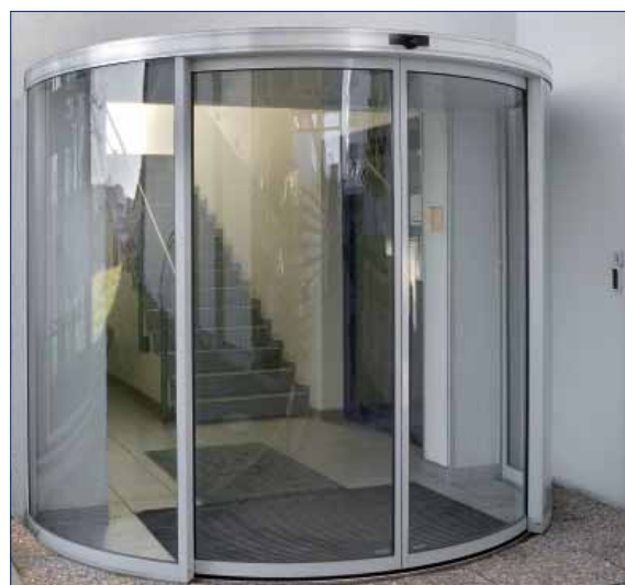
GEZE Technologie- und Entwicklungszentrum

Височина на капака: 150 mm (със скрит горен плъзгач на вратата)